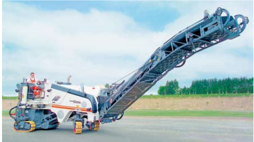
Die Wirtgen GmbH ist Weltmarktführer im Bereich der Kaltfrästechnologie. Das Unternehmen bietet 15 verschiedene Fräsmotive aller Leistungsklassen an.

SAP PLM und die CAD-Direktintegrationen wurden in mehreren, zum Teil parallelen Projektschritten