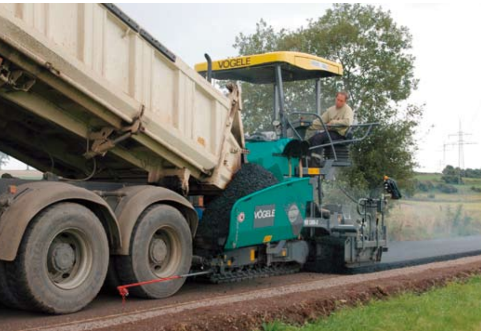
Die neue Generation der Straßenfertiger der Mannheimer Joseph Vögele AG verfügt über ein komplett überarbeitetes Design und ein ergonomisches und intuitives Bedienkonzept.

Serie hingegen werden Dokumente und Materialstämme mit Änderungsstammsatz geändert. „Der SAP Änderungsdienst ist bei Wirtgen beziehungsweise Vögele ein zentraler Prozess zur Unternehmenssteuerung. Er zieht sich durch die gesamte Wertschöpfungskette, von der Vorfertigung, den Stahlbau, die mechanische Bearbeitung, Lackierung, bis zur Vor- und Endmontage. Er regelt das Zusammenspiel von Dokumentenstatus, Dokumentenversion, Material, Materialrevision und Stückliste“, erläutert Dr. Mielke. „Materialrevisionen und Dokumentversionen werden durch das System synchronisiert“.