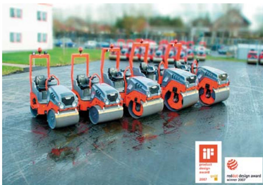
Mit den neu entwickelten kleinen Tandemwalzen der HD-Reihe erschließt der Walzenbauer Hamm AG aus Tirschenreuth ein neues Marktsegment. Die Hamm AG wurde für ihre kleinen Tandemwalzen HD8 bis HD14 mit dem „Design Oscar“, dem iF product design award 2007 in Gold, ausgezeichnet.

Sobald sich ein Produkt in der Serie befindet, muss es mit Änderungsnummer geändert werden. Dazu wird der betroffene Material-